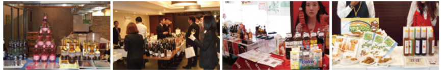
※昨年の展示商談会の様子